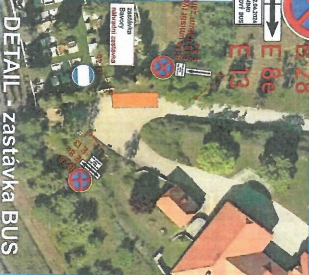
DETAIL - zastávka BUS

Náhradní zastávka a trasa autobusů od 02.04.2024 do 30.09.2024